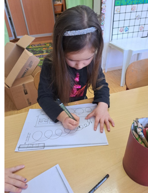
VLAKOVÉ STANOVISĚ grafomotorické cvičení