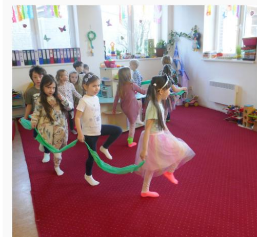
STONOŽKOVÉ STANOVIŠTĚ- ROZVOJ KOOPERATIVNÍCH POHYBOVÝCH DOVEDNOSTÍ (PROCVIČENÍ ZNALOSTI ČÍSEL)