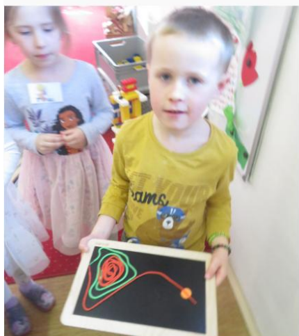
Housenkové stanoviště rozvoj jemné motoriky