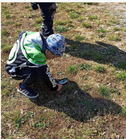
LUPOVÉ STANOVIŠTĚ používání lupy hledání hmyzu v přírodě