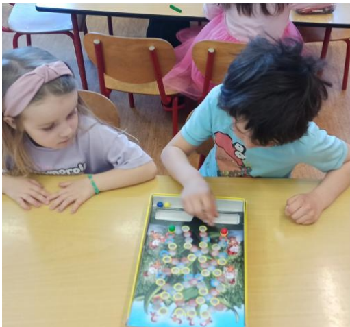
HRAVÉ STANOVIŠTĚ dodržování pravidel stolních her