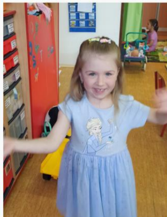
7. Tancovací stanoviště. -SLADÍ POHYB S RYTMEM