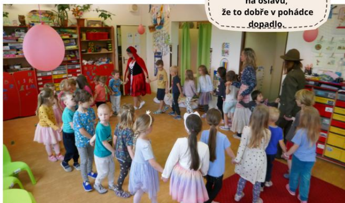
Závěrečný taneček na oslavu, že to dobře v pohádce dopadlo.