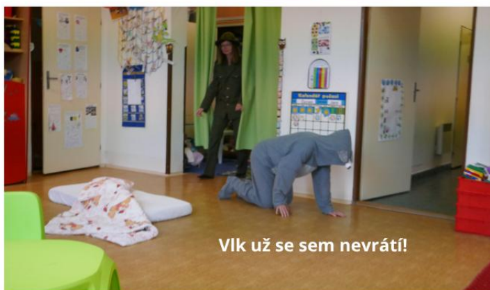
Vlk už se sem nevrátí!