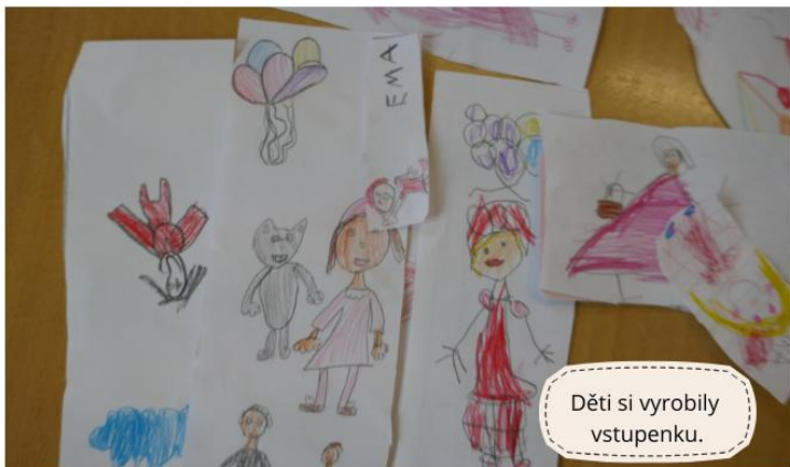
Děti si vyrobily vstupenku.