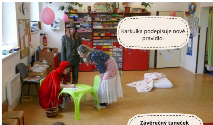
Karkulka podepisuje nové pravidlo.