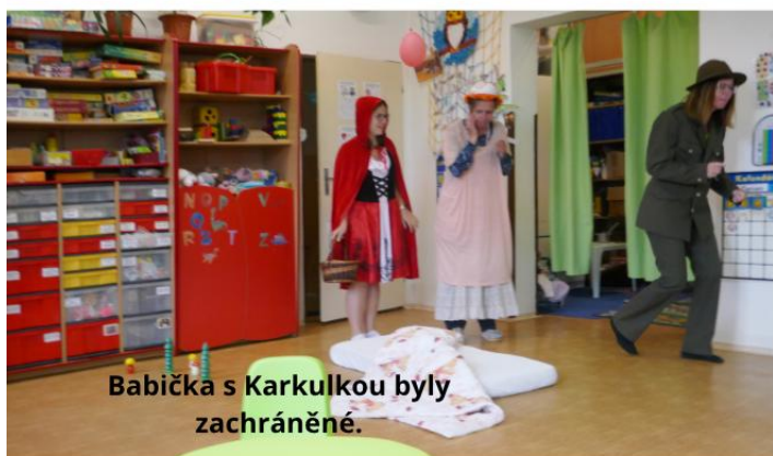
Babička s Karkulkou byly zachráněné.