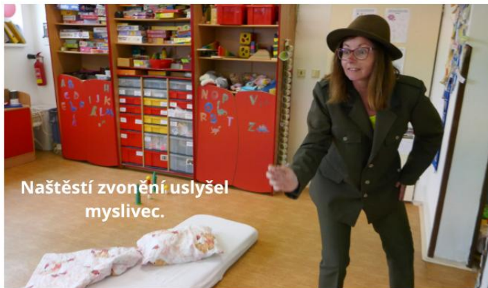
Naštěstí zvonění uslyšel myslivec.