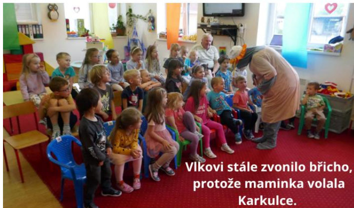
Vlkovi stále zvonilo břicho, protože maminka volala Karkulce.