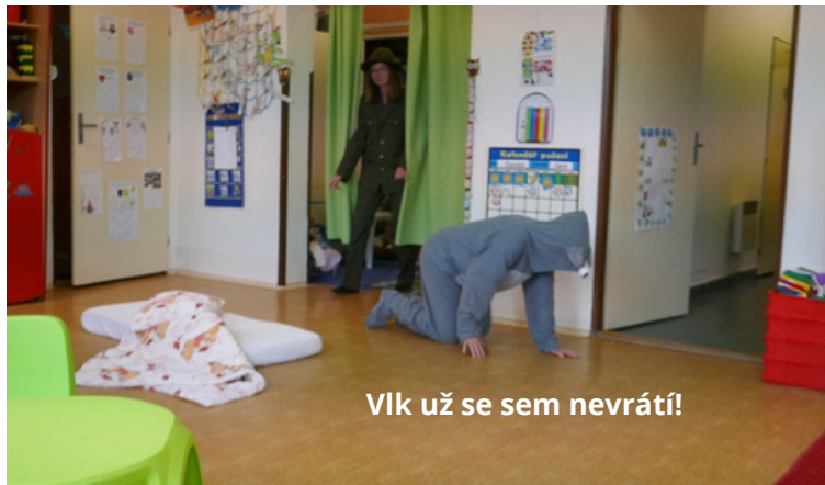
Vlk už se sem nevrátí!