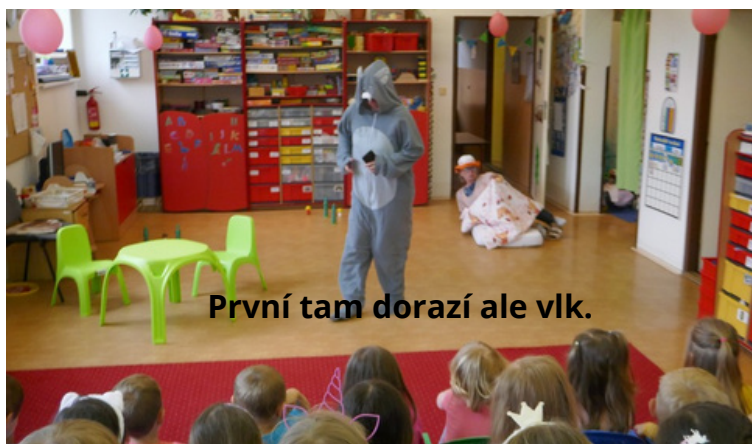
První tam dorazí ale vlk.