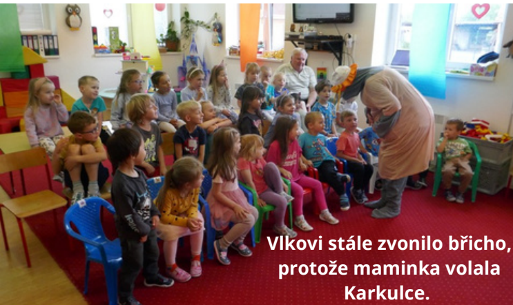
Vlkovi stále zvonilo břicho, protože maminka volala Karkulce.