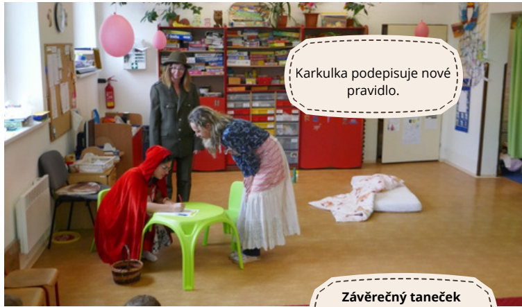
Karkulka podepisuje nové pravidlo.