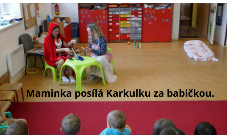
Maminka posílá Karkulku za babičkou.