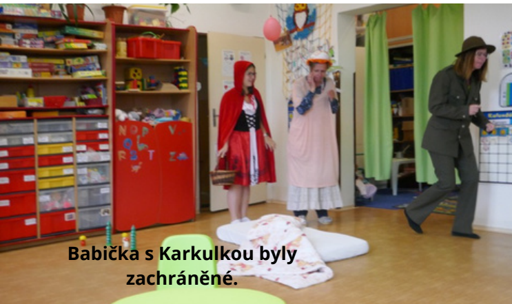
Babička s Karkulkou byly zachráněné.