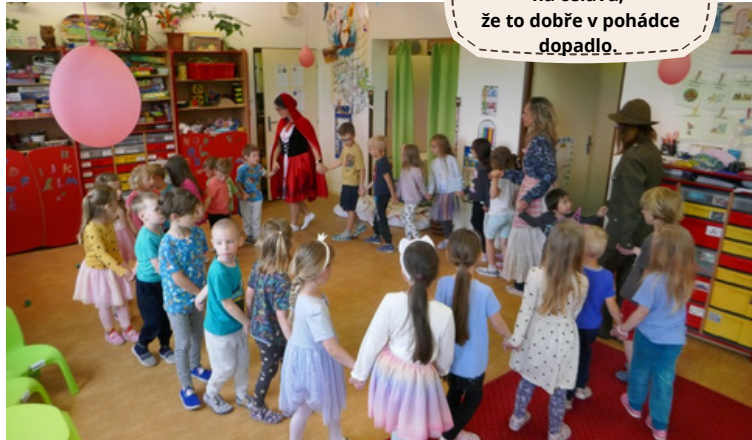
Závěrečný taneček na oslavu, že to dobře v pohádce dopadlo.