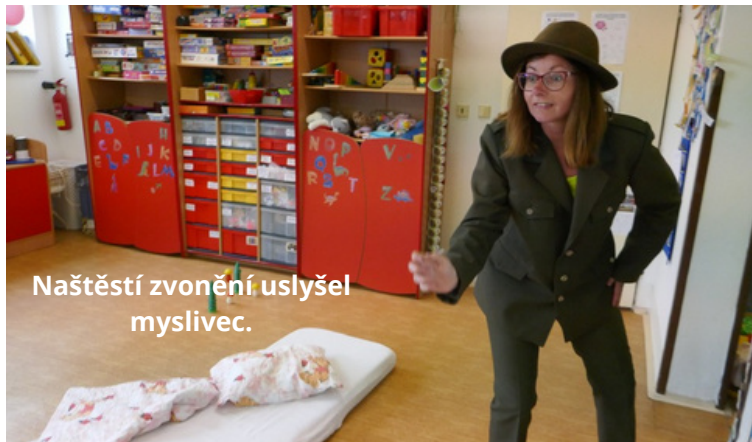
Naštěstí zvonění uslyšel myslivec.