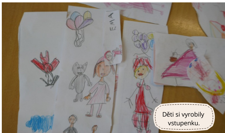
Děti si vyrobily vstupenku.