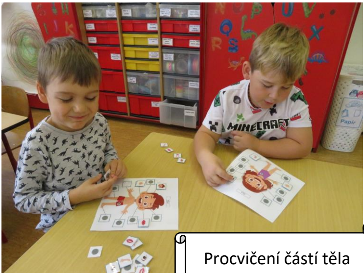
Procvičení částí těla