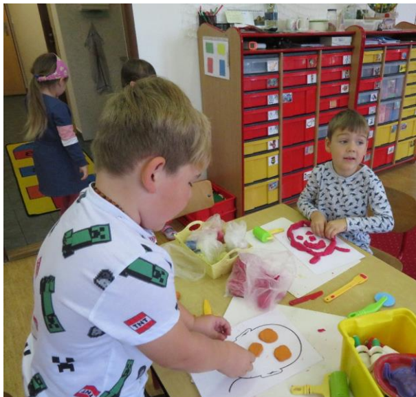
Modelování – lidský obličej