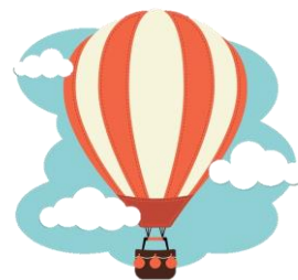
Didaktický list – naše smysly